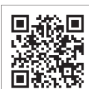
津P連ホームページQRコード